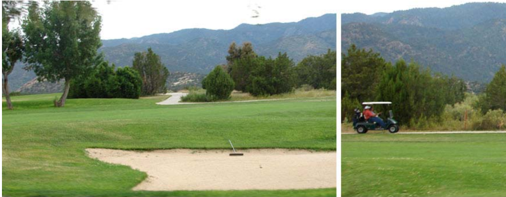
Shadow Hills Golf Club -- 2 Miles From the Property

SHADOW HILLS GOLF CLUB --- 距基地两英里处 SHADOW HILLS 高尔夫球场