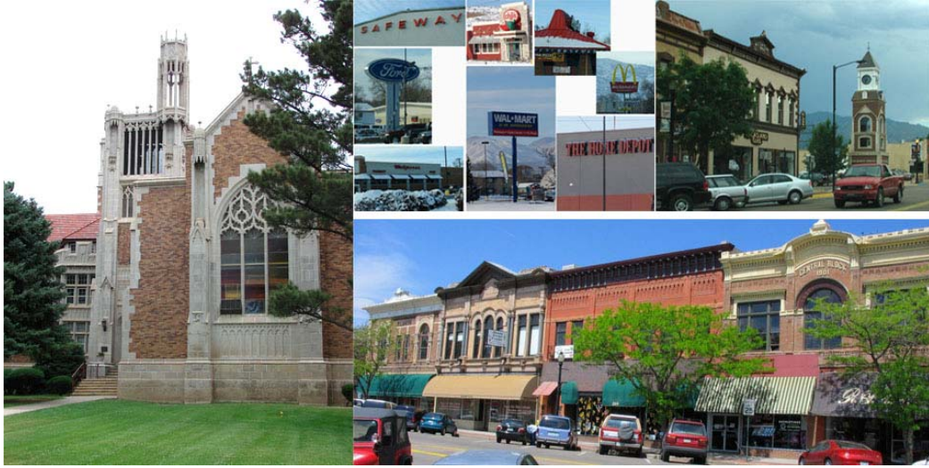
DOWN TOWN CANON CITY 峡谷城市中心既有美国本土小镇古朴本土文化的特征，也有大集团公司的进驻。生活、医疗及教育设施齐全。