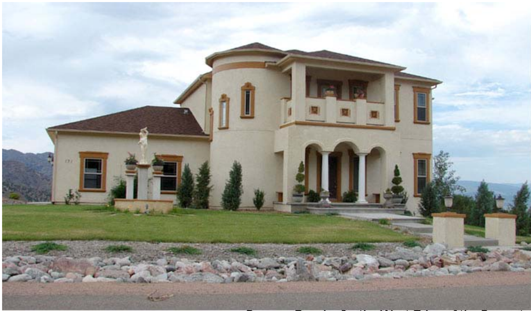
Dawson Ranch--On the West Edge of the Property