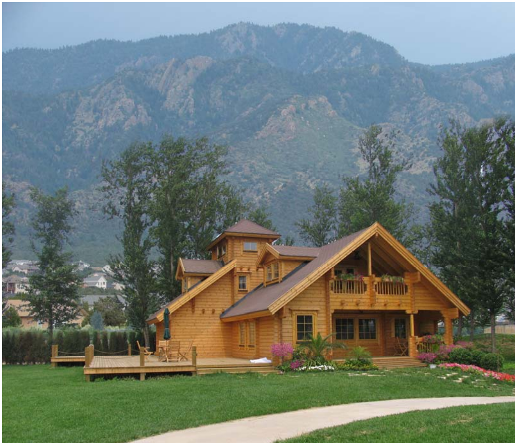
科罗拉多州峡谷城小镇 Canon City 项目中山地木屋实景合成

如果您并不热衷与美国大型移民城市，希望体验并融入美国本土文化，享受更优质的美国医疗服务，科罗拉多州区域中心推出的峡谷城小镇 Canon City 是不错的选择。小城位于阿肯撒河谷中，紧邻主要景区 Royal Gorge，在落矶山脉国家森林公园。峡谷城小镇娱乐活动众多---钓鱼,漂流,宿营,登山,看野生动物,打高尔夫球。其市中心是科罗拉多州最大的历史文化及商业保护区，有深厚的文化底蕴。小城距美国最大军事基地 Colorado Spring 城只有 35 分钟车程，就业机会较好。小城很适合向往健康生活方式的初期退休人群，既有世外桃源的宁静，亦有生活的必须设施。且生活成本较低。